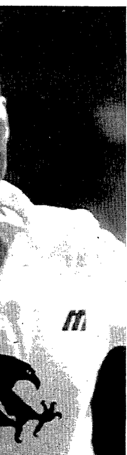
en el RCT Barcelona