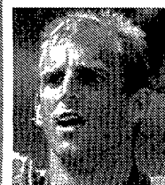
Thomas Muster 6/2-6/1-6/4