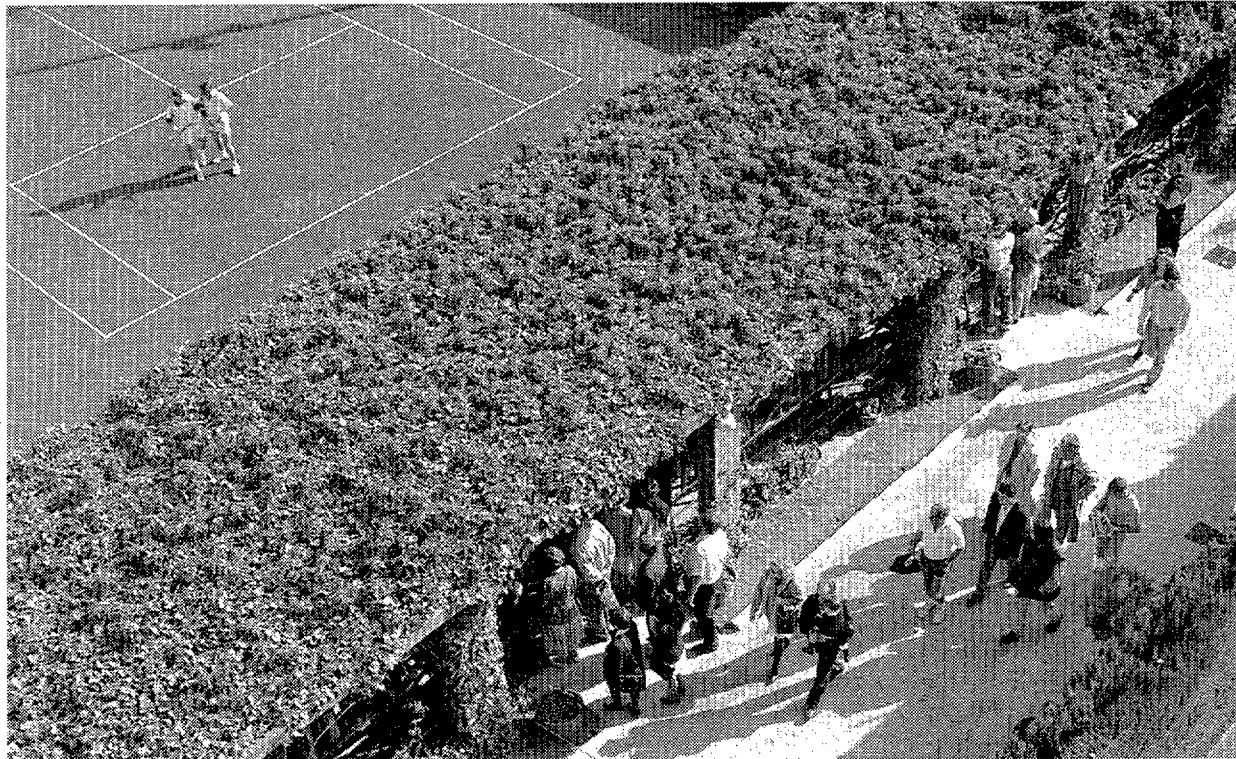
Una vista general de la pista 1 del RCT Barcelona

Esta es la última vez en que el Trofeo Conde de Godó coincide con la Semana Santa ya que a partir de la próxima edición modifica sus fechas y pasa a celebrarse en la tercera semana de abril. Este reajuste del calendario, decidido por la ATP, representa el inicio de una nueva etapa para el torneo barcelonés, que “se verá reforzado y apoyado”, según dijo Cambra, por su cercanía con el de Montecarlo, que se disputará la semana siguiente del Godó. “Barcelona y Montecarlo acogen los dos primeros grandes torneos de tierra europeos”, prosiguió el director del Godó, “y su proximidad nos ayudará, como mínimo, a mantener el alto