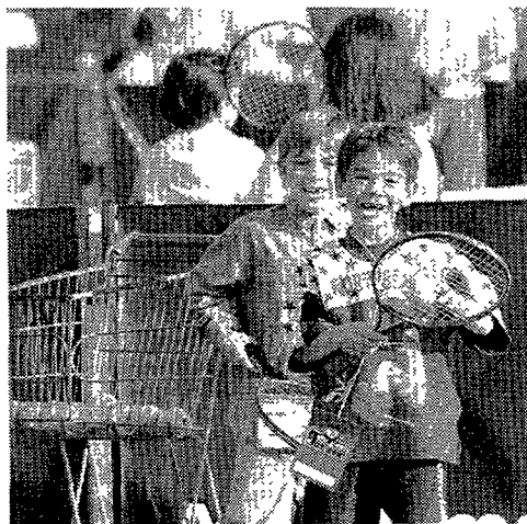
Tenis y estrellas para los menores

Ayer, mientras las pistas del RCT Barcelo-