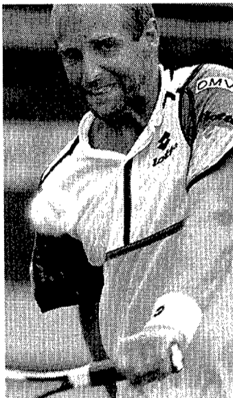
Muster tuvo problemas

Para Thomas Muster era un día especial. Volvía a ese torneo del que fue ganador dos años seguidos (1995 y 1996), pero sabiendo que el primer partido de cualquier competición es siempre "difícil" para todo jugador. Perder el domingo en Estoril la final ante el vasco Berasategui no le afectó: "Si me comparo con el año pasado estoy mucho mejor; entonces no llegué siquiera a disputar unos cuartos de final en tierra. Ahora al menos ya he jugado una final", dijo el austriaco.