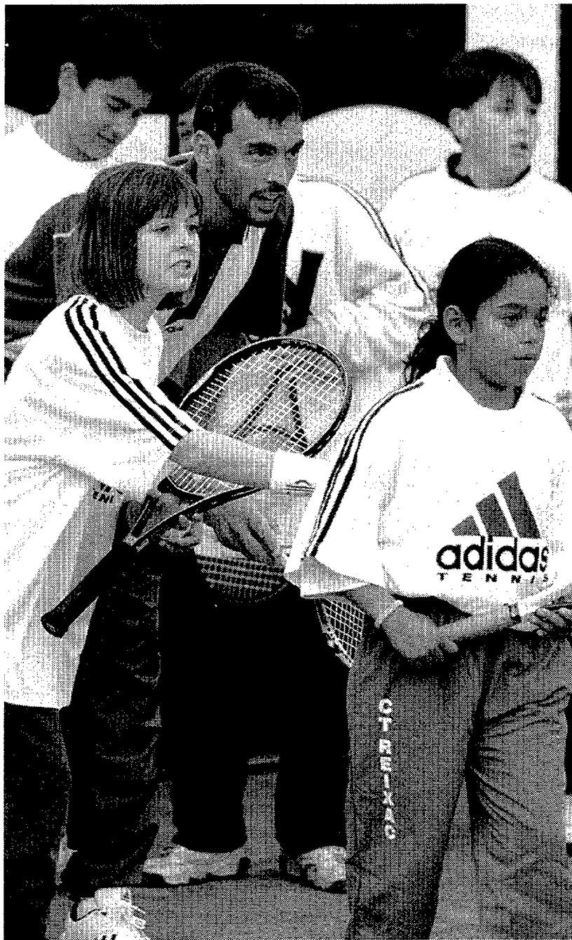
Bruguera posa con algunos de los niños que participaron en el clinic Adidas

Bruguera comenzó a jugar el Trofeo Conde de Godó en 1988, cuando tenía 17 años. Entonces no pasó de la primera ronda con el argentino Horacio de la Peña. Al año siguiente ya fue cabeza de serie. Su mejor momento lo tuvo en 1991 cuando llegó a la final contra Emilio Sánchez. En aquel partido se ganó el cariño del público, pero perdió el título. Dos años más tarde llegó otra vez a la final, pero cayó derrotado ante el ucraniano Andrei Medvedev. Pero ese año ganó por primera vez en Montecarlo y Roland Garros, y tres torneos más. ●