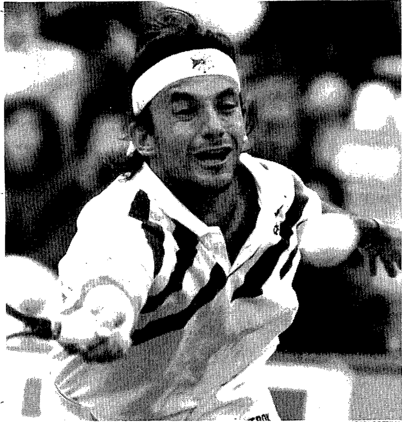
Emilio Sánchez demostró ambición de victoria ante Martín Jaite

Martin Jaite no comprende que el público esté contra Sánchez Vicario