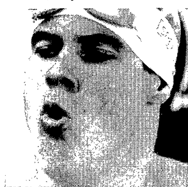
Martín López Zubero

El nadador español Martín López Zubero consiguió ayer la mejor marca mundial en 200 metros espalda con un tiempo de 1.52.51, mejorando en 3"42 el