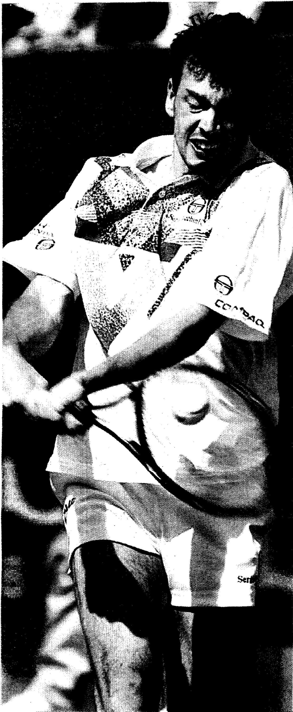
Sergi Bruguera, de 23 años, último campeón de Roland Garros y quinto jugador del mundo