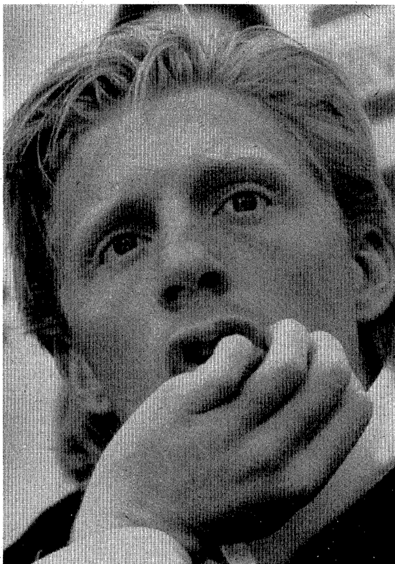
Boris Becker durante la rueda de prensa que celebró ayer en Barcelona

La conferencia de prensa abundó en preguntas suspicaces. La forma cómo se había producido la baja de Becker en el torneo, unas horas antes de efectuarse el sorteo, creó la