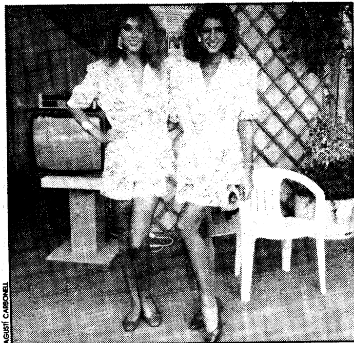
Las dos azafatas de «La Vanguardia» en el Trofeo Conde de Godó