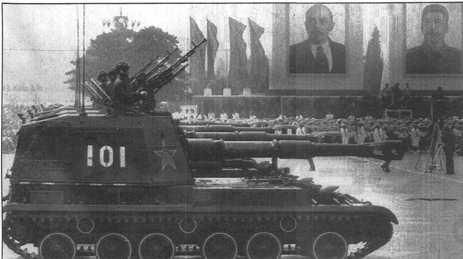
Un carro de combate desfila en Pekín, ante monumentales retratos de Lenin y Stalin