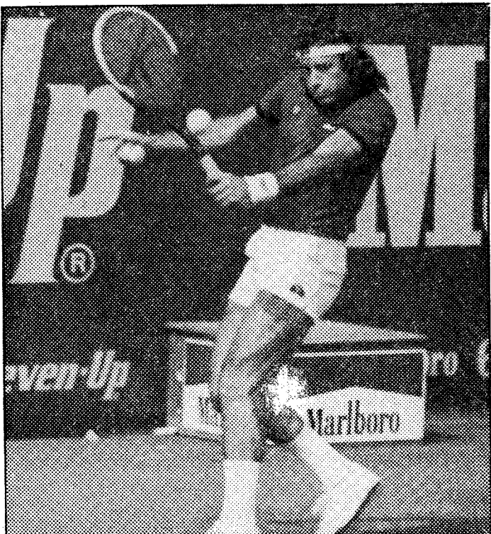
Empezaron al frente del cuadro y hoy serán los protagonistas.