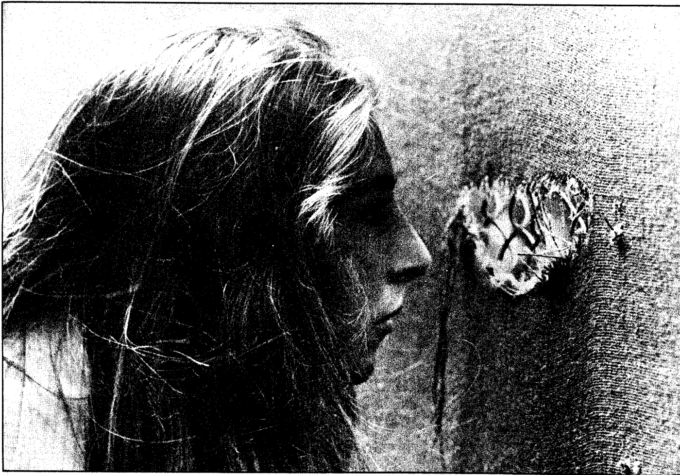
A falta de una silla, un agujero en la «bambalina» le permite a esta guapa espectadora seguir el partido Vilas - Soler.