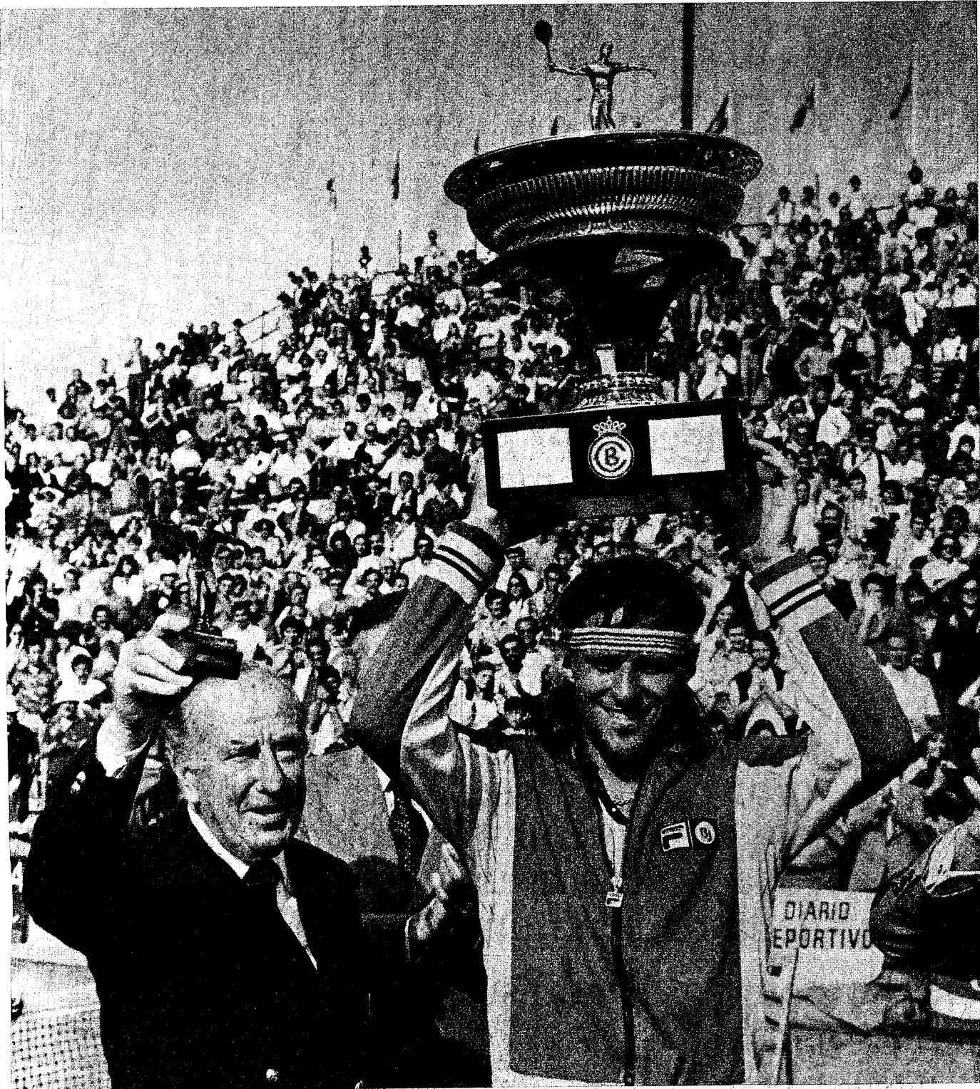
Borg, con el Conde de Godó, presidente honorario del Real Barcelona, tras recibir el Trofeo de las «Bodas de Plata». El sueco, campeón irresistible, venció a Orantes por 6-2, 7-5 y 6-2, revalidando así su victoria en la edición de 1975