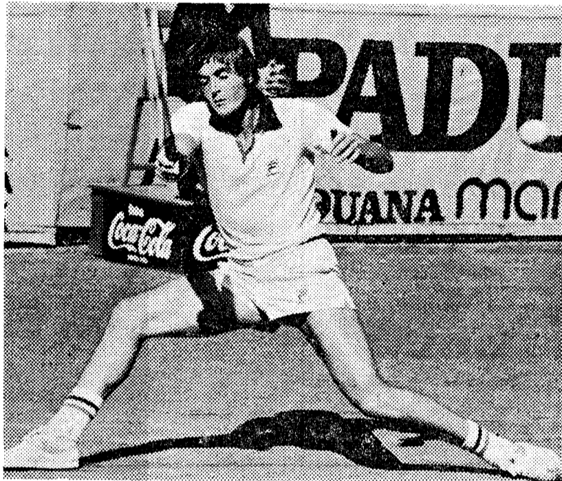
Adriano Panatta, finalista de Madrid, tendrá una nueva oportunidad; esta vez ante el potente y veloz sueco Bjorn Borg, gran favorito de la prueba individual masculina.

Vilas quiso mantener a raya al sueco a base de envíos muy fuertes y liftados que pasaban a dos metros de la cinta y la réplica era idéntica, pues Borg, que es maestro en eso de elevar la pelota, aseguraba cada golpe sin exponer