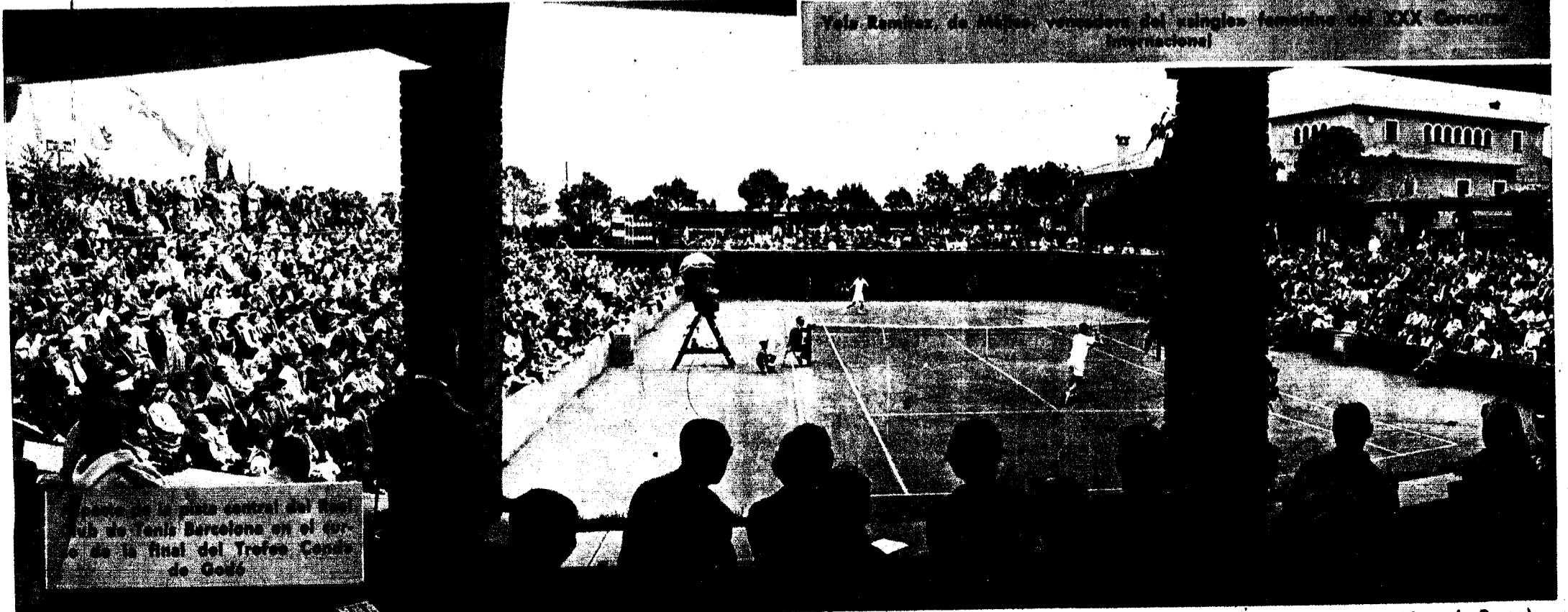
La pista central del Club de Tenis Barcelona en el momento de la final del Trofeo Conde de Godó