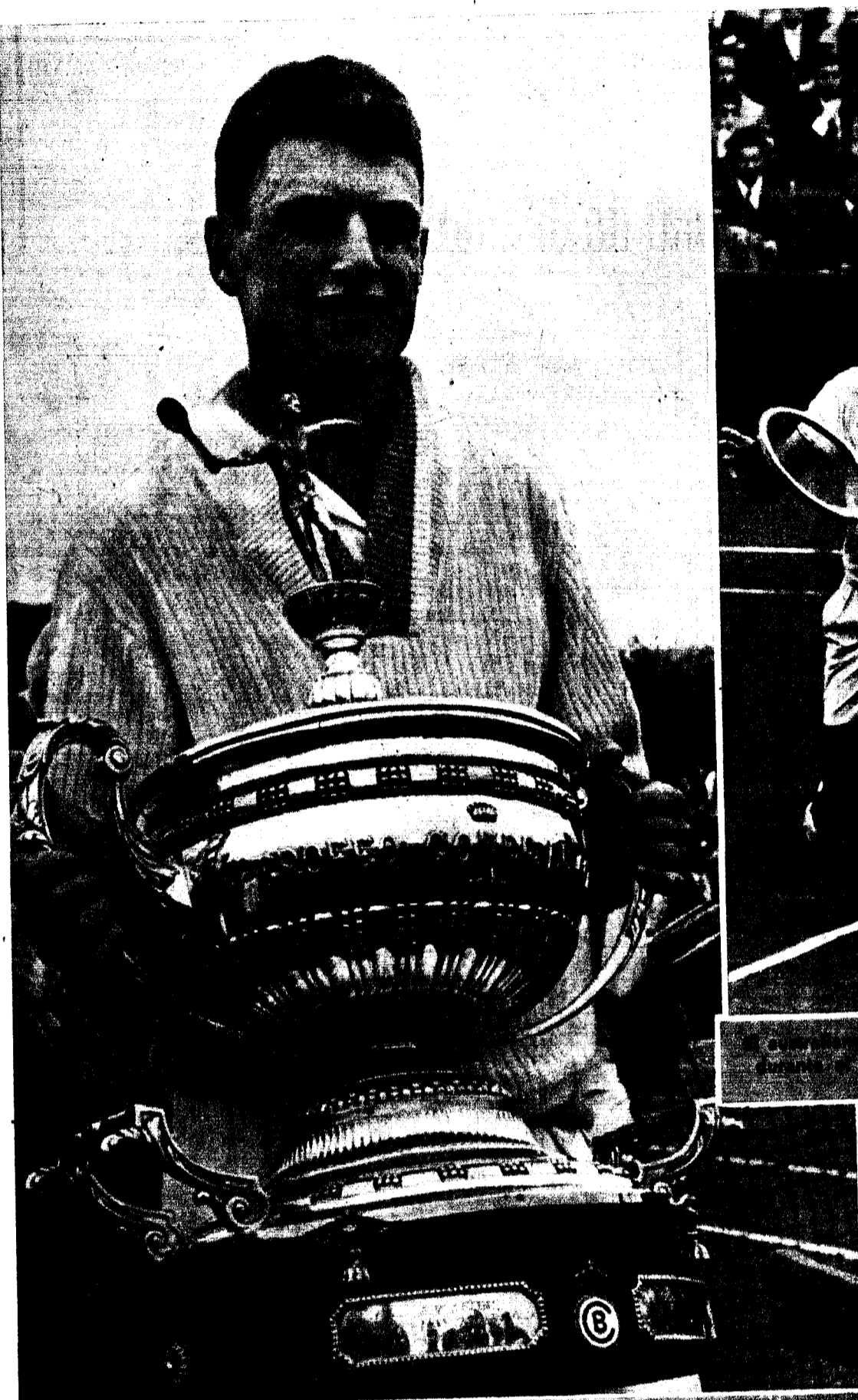
Herbert Flam, el gran tenista norteamericano, con el Trofeo Conde de Godó, que el domingo ganó por segunda vez consecutiva